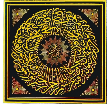
Айяг Света. (Коран, XXIV, 35). XVIII в.

Тот факт, что в названии этой статьи поставлены рядом имена двух философов, живших и творивших в столь разные эпохи, в условиях далеко не похожих культур и цивилизаций, сам по себе требует разъяснения. Николай Бердяев, принадлежавший к тому направлению русской философии, которое именovalo себя мистическим, сегодня не нуждается в том, чтобы быть представленным читателю. Мохиддин Ибн Араби (1165-1240), величайший мистик арабского средневековья, известен как основатель философской концепции, которая, получив в дальнейшем название «единство бытия»,